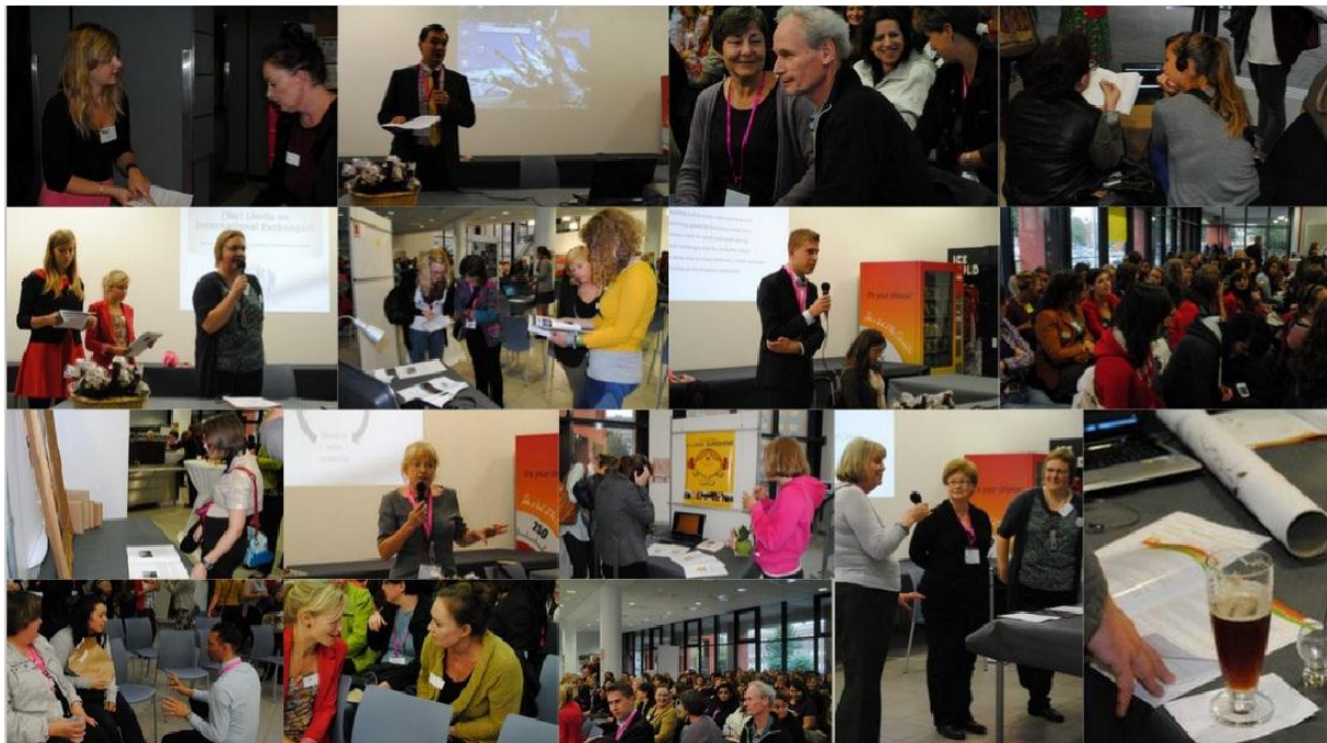
Mobility event 03/10/2012